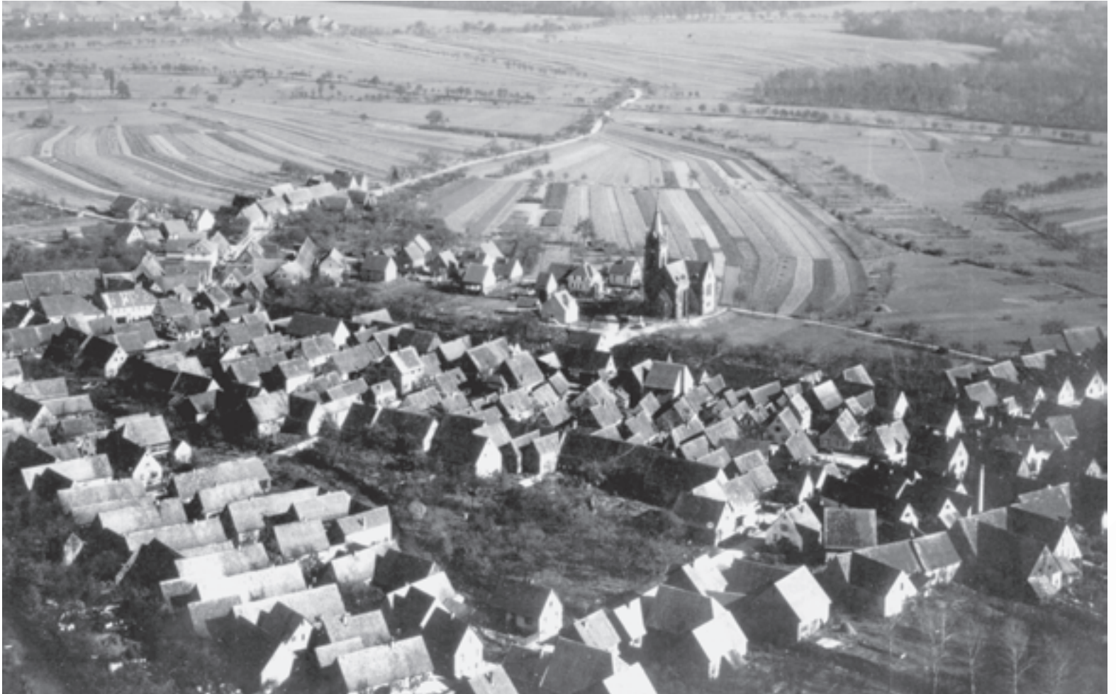
Die Luftaufnahme vom 18. Oktober 1931 zeigt eigentlich noch das alte Stafford, wie es bis ins 19. Jahrhundert bestand. Ein ganz neuer Akzent war nur durch die Kirche gesetzt worden, die aber nach wie vor am Ortsrand stand.