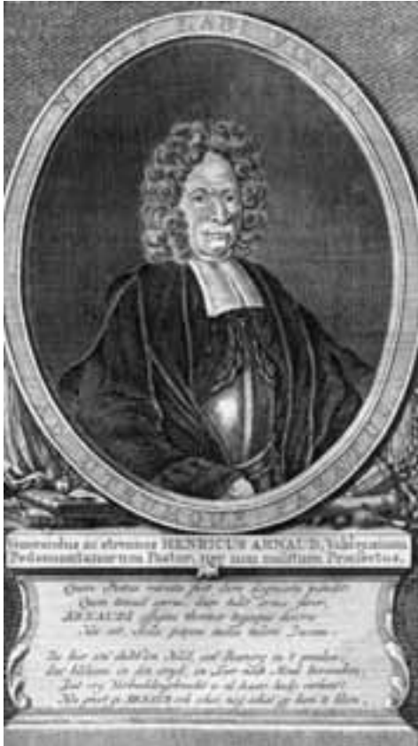
Abb. 12: Henri Arnaud (1643-1721). Kupferstich von Nicolaas van Frankendaal