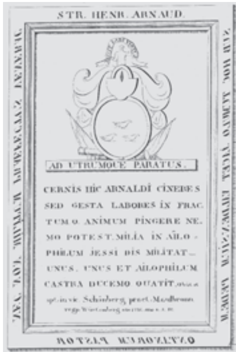
Abb. 10: Das Bildnis der Grabplatte von Henri Arnaud aus dem 18. Jahrhundert