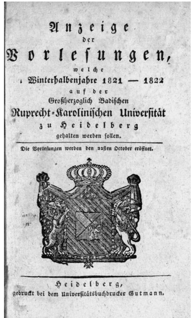
Kat. Nr. 13