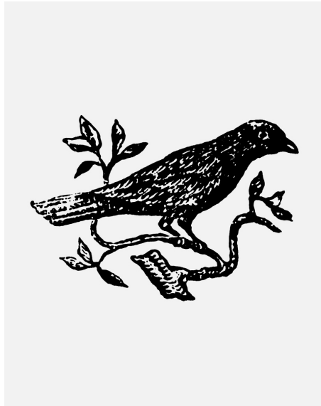
Das Firmenemblem des Galanteriewarengeschäfts von Hermann Kafka zeigte eine Dohle, tschechisch: »kavka«.

Das Verhältnis Kafkas zu seinem Vater bildet den Ausgangspunkt vieler literaturwissenschaftlicher Werkanalysen. Es bestimmt mehr oder weniger das öffentliche Bild, das man sich von Kafka macht. Der »Brief an den Vater« (1919) dokumentiert eindrucksvoll die Bedeutung, welche die mit Vorwürfen und Schuldgefühlen belaste-