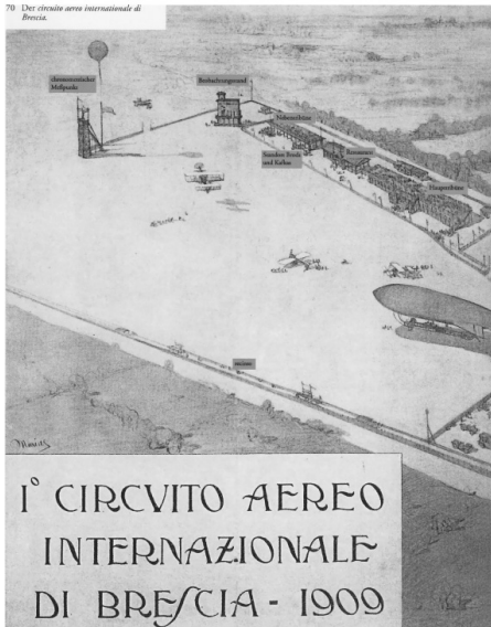
Der »Primo Circuito Aereo Internazionale di Brescia« – Abb. aus: Hartmut Binder, Mit Kafka in den Süden. Eine historische Bilderreise in die Schweiz und zu den oberitalienischen Seen (Prag 2007), 54

nicht weitergeführt wurde, lag offenbar nicht nur an den Schwierigkeiten, die das gemeinsame Schreiben mit sich brachte, sondern wahrscheinlich auch an der dargestellten Freundschaftsbeziehung zwischen Männern.