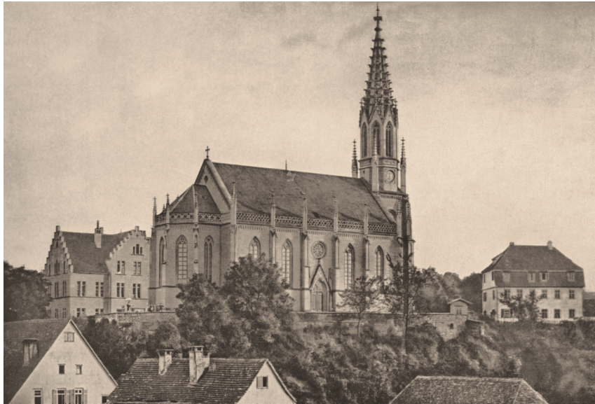
Kirche in Stuttgart-Berg

exponierten Lage und seiner Nachbarschaft besondere Bedeutung zu. Diese war charakterisiert durch die in jener Zeit im Bau befindliche Villa des Kronprinzen Karl in Berg und dem Landschloss Rosenstein, der Sommerresidenz des Königs. Bei dem in neugotischen Formen errichteten massiven, kreuzrippengewölbten Sandsteinbau mit einem vor die Westfassade gestellten Turm mit filigraner Sandsteinpyramide beherrschten städtebauliche Gesichtspunkte die Diskussion. Der 65.000 Gulden teure Bau wurde schließlich zum Teil (25.000 Gulden) aus der Privatschatulle des Königs finanziert, den Rest trug die Staatskasse.