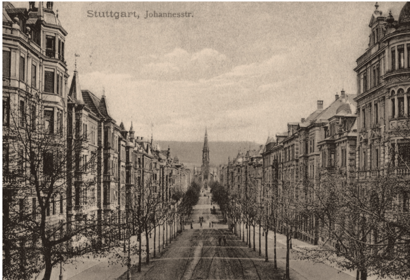
Johannesstraße mit Johannes- kirche

Frage wegen der Forderungen der privaten Grundstücksbesitzer. Man wick daraufhin auf einen Platz im Eigentum der Stadt am Feuersee aus. Zwischen 1865 und 1876 wurde auf einer Halbinsel im eigens für den Kirchenneubau zur Rechteckform erweiterten Feuersee die Kirche im Stuttgarter Westen errichtet. Der Bau wurde zum städtebaulichen Mittelpunkt des neuen Wohngebiets, das nach der Grundsteinlegung der Kirche rasch gewachsen ist. Die für das 19. Jahrhundert typische rasterförmige Straßenführung dieses Wohngebiets ist ganz auf den Kirchenbau ausgerichtet. Die breite mit Bäumen gefasste Hauptachse dieses westlichen Stadtteils bildete später die schnurgerade auf die Turmfront der Kirche zulaufende Johannesstraße. Mit ihrer vier- bis fünfgeschossigen Mietshausbebauung war sie vor den Zerstörungen des Zweiten Weltkriegs die einzige gründerzeitliche Prachtstraße Stuttgarts.