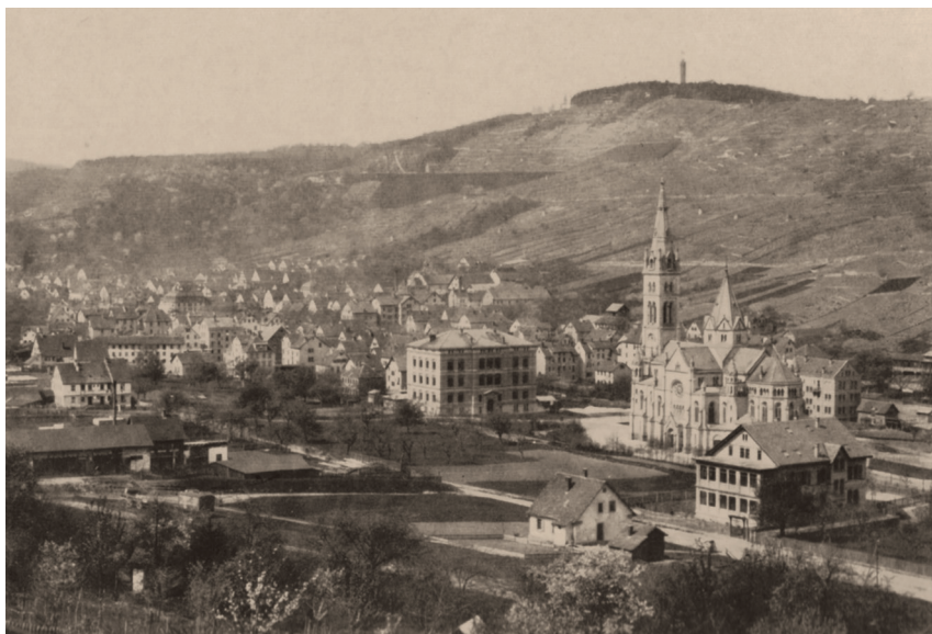
Matthäuskirche in Heslach

Der zweite Kirchenneubau Stuttgart im 19. Jahrhundert entstand für die im Südwesten gelegene Vorstadt Heslach (1889–1933 Karlsruhvordstadt), die 1895 den Namen Matthäuskirche erhielt. Sie wurde anstatt eines alten, zu klein gewordenen Vorgängerbaus aus dem