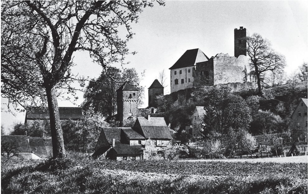
Burg Neidenstein auf einer historischen Postkarte, Datum unbekannt.

Im Kraichgau fehlte deshalb eine die Konkurrenz fördernde Siedlungskonzentration. Vielleicht ist das der Grund, dass sich deshalb keine intensive Erwerbsdifferenzierung herausbilden musste und der Landhandel der vorherrschende Berufszweig blieb. 54