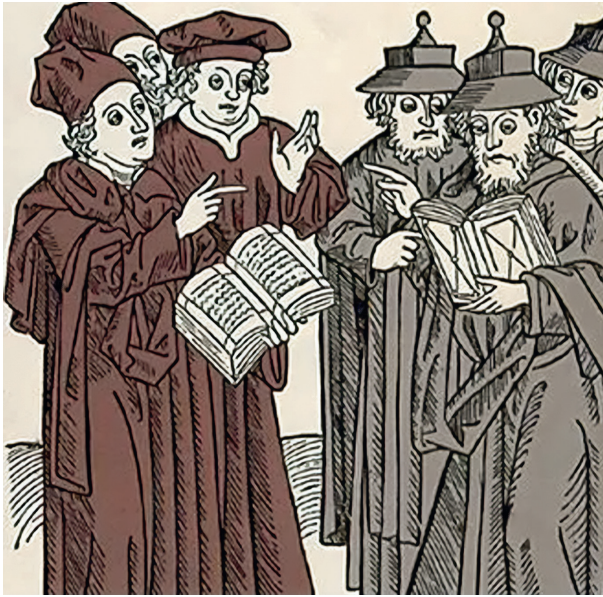
Judentracht des Josel von Rosheim (1478–1554). Er war anerkannt als der gewählte regierer allgemeiner jüdischheit. 21

Das Vierte Laterankonzil, eine mittelalterliche Synode der katholischen Kirche von 1215 und das Mainzer Diözesankonzil von 1229 ordneten eine Kennzeichnungspflicht für Juden an.