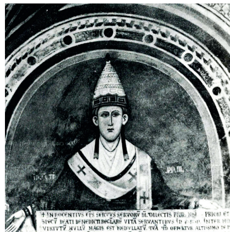
Papst Innozenz III. (1161–1216), Papst der römisch-katholischen Kirche von 1198–1216.

Auch wenn die Kirchenspitze nicht zu tätlichen Ausschreitungen gegenüber den Juden aufrief, befeuerte die päpstliche Haltung die Kleriker in ihrer antijüdischen Haltung. Thomas von Aquin (1225–1274), eine kirchliche Autorität jener Zeit, erklärte es für rechtens, dass die Kirche über jüdisches Eigentum der Ermordeten