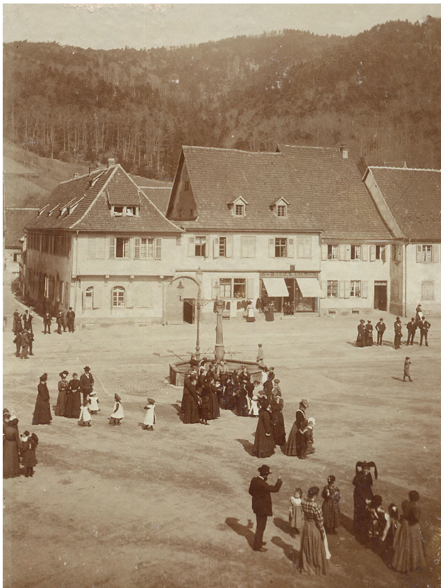
Der Sulzburger Marktplatz um 1900; im Hintergrund (mit Markisen) das allseits beliebte jüdische Bekleidungsgeschäft von Leo Weil