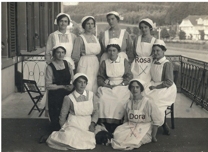
Im Friedrich-Luisen-Hospiz in Bad Dürkheim, Karte von 1916 (oben), von 1915 (unten)