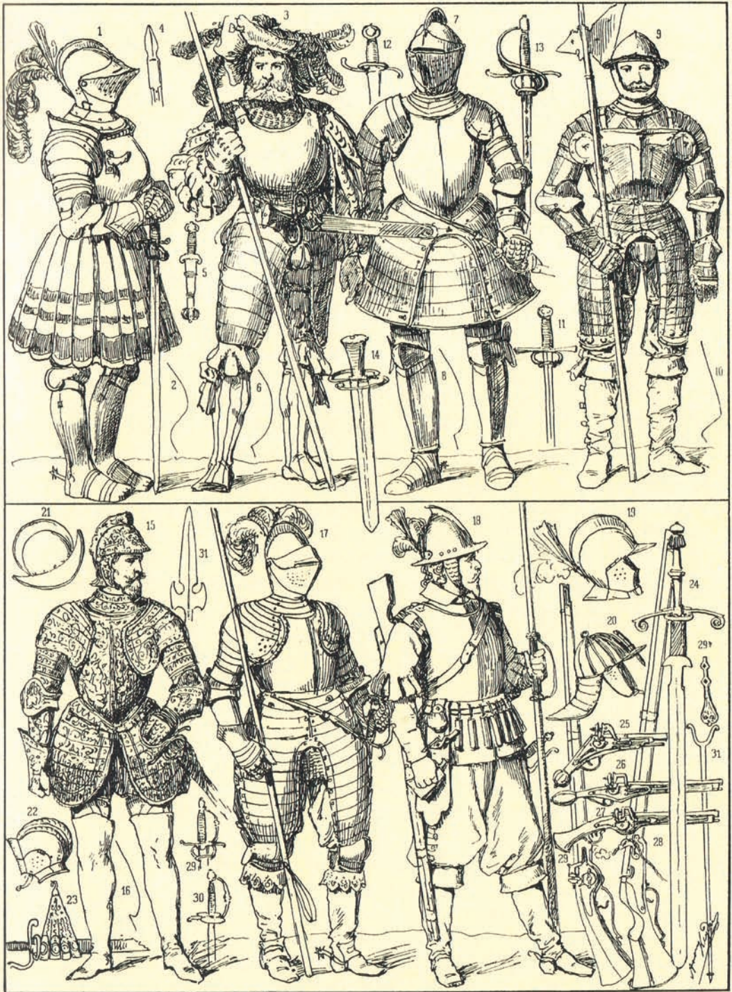
Rüstungen und Waffen des 16. und 17. Jahrhunderts (StadtA Eppingen)