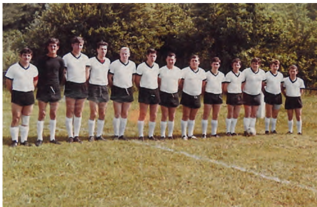
Die Meisterschaft des SCW in der Spielzeit 1968/69 darf als Motivation in einer Dorfgeschichte nicht fehlen.