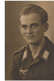
Richard Karl Ernst