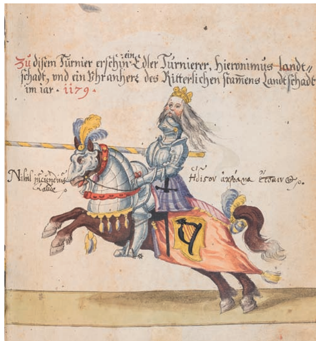
Abb. 27: Hieronymus Landschad 1179 beim Turnier in Köln (Stuttgarter Handschrift 298a)

Landschad beim Turnier von 1392 in Schaffhausen (Abb. 26, 27, 29, 30). In den Abbildungen in dem in der Vatikanischen Bibliothek aufbewahrten Exemplar reiten die angeblich an den Turnieren von 1179 sowie 1392 beteiligten Landschaden Philipp und Hans allerdings jeweils in die entgegengesetzte Richtung, nämlich nach rechts gerichtet (Abb. 28, 31).