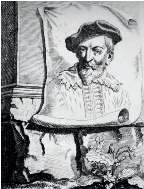
Abb. 1: Jost Amman (Stich um 1769)

Jost Amman (1539–1591), ein aus Zürich stammender Zeichner, Radierer und Maler, der bereits in jungen Jahren nach Nürnberg übersiedelte und dort bis zu seinem Tod