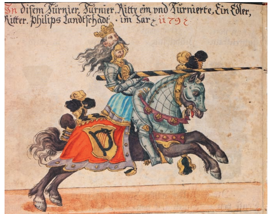
Abb. 28: Philipp Landschad 1179 beim Turnier in Köln (Cod. Ross. 711)

setzen die Pferde zum Galoppsprung an, so dass sich diese Bewegung in die Decke des Pferdes fortsetzt. Diese Decke ist mit dem Harfenwappen versehen und ermöglicht so – zusammen mit dem Davidshaupt als Helmzier – die Identifizierung des Ritters als Angehörigen der Landschaden von Steinach, die zusätzlich namentlich genannt werden. Eine nicht erklärbare Besonderheit weisen die Abbildungen 26 und 27 auf: Vor dem Kopf der Tiere ist der Sinnspruch „Nihil iucundius laude“ (nichts ist erfreulicher als das Lob bzw. der Ruhm) eingefügt.