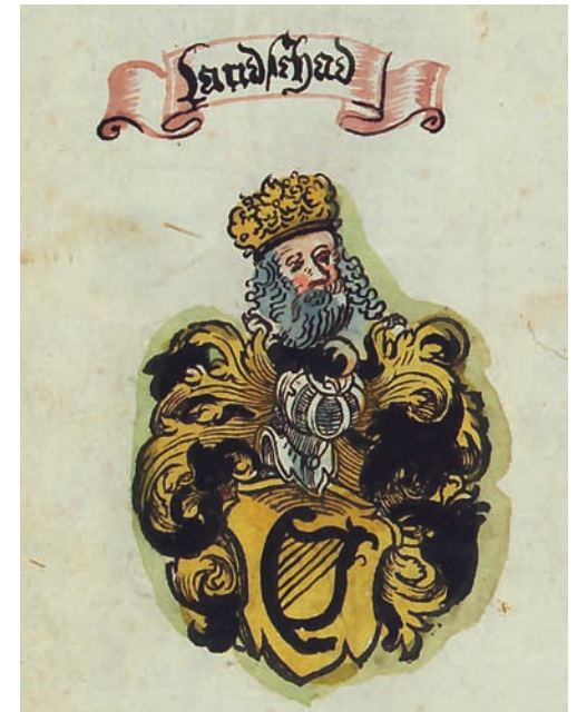
Abb. 4: Das Harfenwappen der Landschaden aus Jost Ammans Wappenbuch (Ausschnitt aus Abb. 3)

Ammans zweites, bei Feyerabend in Frankfurt am Main gedrucktes und verlegtes Werk, das ebenfalls ein Harfenwappen enthält, hat er „Dem ehrnvesten vnd achtbarn