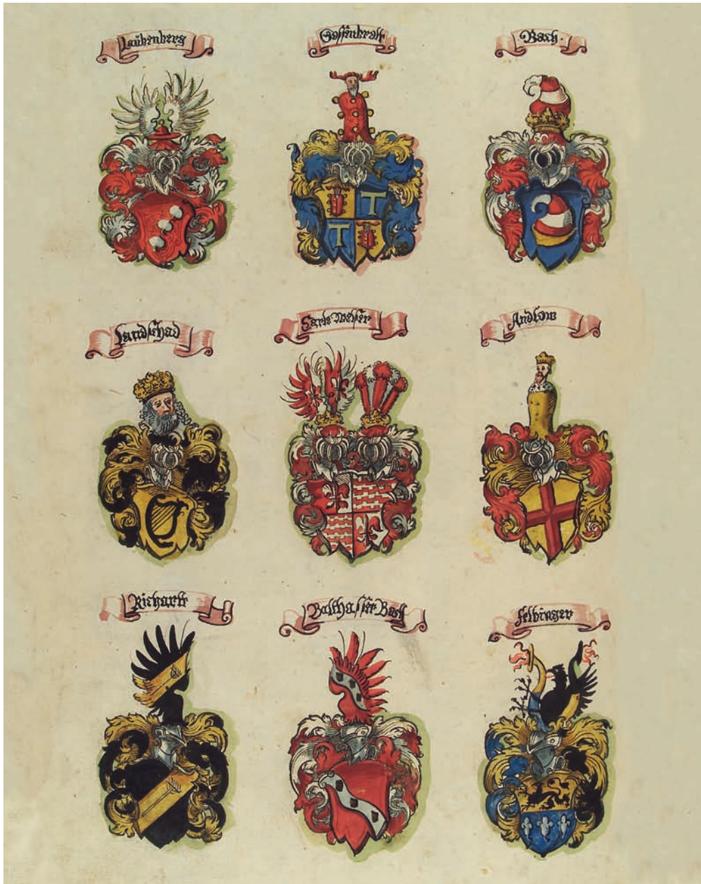
Abb. 3: Seite aus Jost Ammans Wappenbuch mit dem Harfenwappen der Landschaden

doch fein gestaltet (Abb. 3). 18 Der Schild ist allerdings geradezu überwuchert von den Helm umgebenden Applikationen und enthält eine Harfe (schwarz auf Gold) mit wohl sechs Saiten und einem in Fortsätzen auslaufenden Corpus. Die Helmzier weist den Davidskopf mit Vollbart auf (Abb. 4).