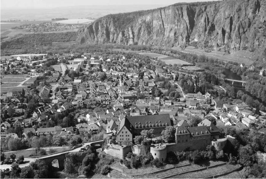
Die Ebernburg in Bad Münster am Stein-Ebernburg.