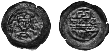
Abb. 3: Annweiler am Trifels. Pfennig, ca. 1250. 13 mm // 0,38 g. Vs.: Gekröntes Brustbild von vorn Kreuz und Zepter. Rs.: Burgmauer, darüber ein Zinnenturm, links ein Kreuz und rechts ein Ringel. Scherer/Ehrend, Die Münzen von Annweiler-Trifels , Nr. 37/38. IKMK Berlin – Objektnr. 18269866.

Münzen aus Annweiler tauchen vereinzelt in Schatzfunden sowohl in der Pfalz als auch in Baden und im Elsass auf, sodass wir wohl von einem weitläufigeren Umlaufgebiet im Sog der Speyrer Münzen und einer weitestgehend kontinuierlichen Prägung vor Ort ausgehen dürfen. In größeren Mengen kamen sie aber nur in den Schatzfunden von Gleisweiler (10 km) und Minderslachen (24 km) vor, also im näheren Umfeld des Münzstätten- und Marktbetriebs. 42 Erwähnt werden „Pfennige von Annweiler“ darüber hinaus nur einmal in einer Urkunde der benachbarten Zisterzienserabtei Eußerthal (5 km) bei einer Zahlung aus dem Jahre 1277: „ pro tribus libris denariorum Anewilre “. 43 Hierin kommt sicherlich die enge Verbindung des Klosters zum Trifels zum Ausdruck, auf dem die Mönche als Burgkaplane wirkten und das 1186 von Friedrich I. unter den Schutz des Reiches gestellt wurde. Zu einer weiteren Verringerung des Pfenniggewichts kam es wohl zum Ende der Regierung Friedrichs II. um 1250 – oder vielleicht genauer im Zuge der unsicheren Situation im Umfeld des Interregnums (1245–1273). 44 Die fortan geprägten Stücke weisen nur noch einen Durchmesser von etwa 17 mm bei einem Durchschnittsgewicht von 0,37 g auf (Abb. 3–6).