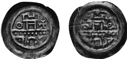
Abb. 5: Annweiler am Trifels. Einseitiger Pfennig, ca. 1250. 18 mm // 0,47 g. Burgmauer, darüber ein Zinnenturm, links ein Ringel mit Punkt und rechts ein Kreuz. Scherer/Ehrend, Die Münzen von Annweiler-Trifels , Nr. 39. IKMK Berlin – Objektnr. 18269868.