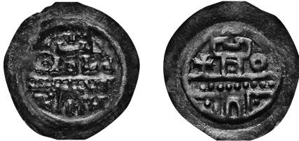
Abb. 4: Annweiler am Trifels. Einseitiger Pfennig, ca. 1250. 16 mm // 0,31 g. Burgmauer, darüber ein Zinnenturm, links ein Kreuz und rechts ein Ringel. Scherer/Ehrend, Die Münzen von Annweiler-Trifels , Nr. 38. IKMK Berlin – Objektnr. 18269867.