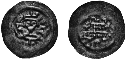
Abb. 6: Annweiler am Trifels. Einseitiger Pfennig, ca. 1250. 15 mm // 0,42 g. Vs.: Gekröntes Brustbild von vorn, rechts und links ein Kreuzstab. Rs.: Burgmauer, darüber ein Zinnturm, links und rechts ein Kreuz. Scherer/Ehrend, Die Münzen von Annweiler-Trifels , Nr. 34/42. IKMK Berlin – Objektnr. 18269869.

Wie steht es nun mit der „städtischen Münzprägung“ in Annweiler? Annweiler (1219) steht am Beginn einer Reihe mit dem Münzrecht beliehener Städte: Bern (1224), Lübeck (1226), Mühlhausen (1251) und Oppenheim (1255). Allgemein hat sich während der Stauferzeit die deutsche Münzstättenlandschaft erheblich gewandelt: Waren zwischen 1140 und 1197 noch etwa 225 Münzstätten aktiv – davon 106 geistliche, 81 weltliche und 28 königliche – erhöhte sich ihre Anzahl zwischen 1197 und 1260 auf etwa 471 – davon 152 geistliche, 277 weltliche, 37 königliche und 5 städtische. 45 Auch wenn sich die Anzahl der königlichen Münzstätten also insgesamt erhöhte, wurden diese dennoch weitgehend aus der Münzprägung verdrängt, da sich die Anzahl weltlicher und geistlicher Münzstätten in noch größerem Maße vermehrte. Auch stellten städtische Münzstätten gerade einmal kümmerliche 1,06 % aller Prägeorte, während sie in Italien den Großteil der prägenden Institutionen ausmachten. Dabei lassen sich jedoch nicht alle Prägestätten einwandfrei belegen, einige wurden anteilig von einem weltlichen und einem geistlichen Münzherrn genutzt ( Kondominium ) und die Prägevolumen lassen sich bestenfalls statistisch über die Menge der gebrauchten Stempel erschließen, da über die Größe der Emissionen noch nicht Buch geführt wurde.