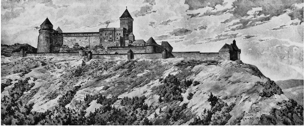
Abb. 18: Bodo Ehardt, „Die Hohkönigsburg im Elsass. Wiederherstellungs-Entwurf. Ansicht von Süden“. Lichtdruck, 1900

Um diesen Standpunkt durch einen Baustil zu markieren, der als genuin national gelten durfte, wählte Schwechten das Formvokabular der Romanik, das nur im Inneren eine hybride Verbindung mit den künstlerischen Ausprägungen einer altnordischen Germanenideologie sowie eines byzantinisierenden Gottesgnadentums eingegangen ist. Nach außen hingegen präsentierte sich eine moderne, höfischen wie administrativen Zwecken dienende Residenzarchitektur unter dem weitgehend stilreinen Deckmantel romanischer Versatzstücke. Vom grob behauenen, teils bossierten Quadermauerwerk über eine Fenstergliederung, die an der Südflanke des Saalbaus mit zweigeschossigen Säulenstellungen die Emporenöffnungen der Aachener Pfalzkapelle zitiert, bis hin zu den Rundfenstern der Kapellenapsis oder den Zwerggalerien insbesondere der bekrönenden Rotunde des Eckturms werden einschlägige Motive aufgeboten, um das burgartige Ensemble mit Würdeformeln des Sakralbaus auszustatten, wie sie sich ähnlich auch an den Domen zu Worms oder Speyer finden.